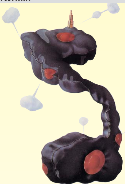
Die meisten Hi-Fi-Anlagen: langweilig, nervend

Auf Wunsch können Sie die so von Ihnen ausgewählten Geräte mit meiner Unterstützung zu Hause anhören, damit Sie erfahren, wie sie sich akustisch und optisch in Ihren Raum einfügen. Sind schließlich alle Anforderungen erfüllt, biete ich Ihnen an, die Installation der ausgewählten Anlage vorzunehmen.